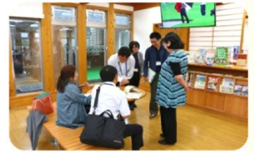
参加者で「道の駅」を点検 ※道の駅「はわい」「琴の浦」を点検