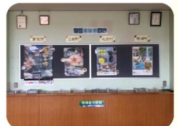
分かりやすく市・町ごとにパンフレットを配置