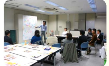
ワークショップでは、議論した事は最後に発表して共有