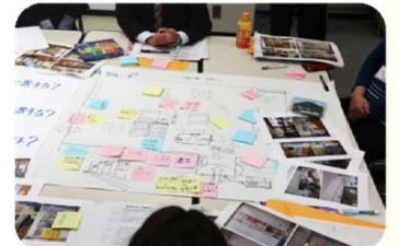
点検結果を基に情報提供コーナーの活用アイデアを議論